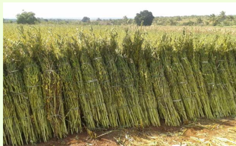
Mavuno ya zao la Ufuta

Pamoja na mafanikio yaliyojitokeza, mambo yafuatayo yanapaswa kuzingatiwa: