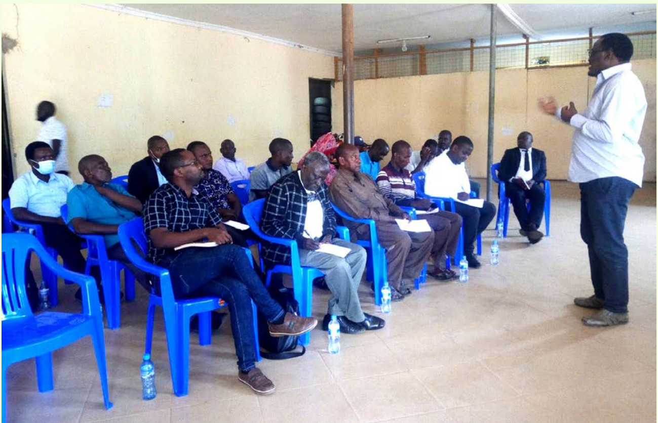
Viongozi wa Vyama vya Ushirika na wawakilishi wa wakulima wakielimishwa juu ya matumizi ya Mfumo wa Stakabadhi za Ghala

Mkoa wa Mwanza, Wakuu wa Wilaya, Wakurugenzi wa Halmashauri, Wawakilishi wa wakulima wa Choroko, Soko la Bidhaa Tanzania (TMX), Bodi ya Usimamizi wa Stakabadhi za Ghala, Viongozi wa Chama Kikuu cha Ushirika na Tume ya Maendeleo ya Ushirika Tanzania (TCDC).