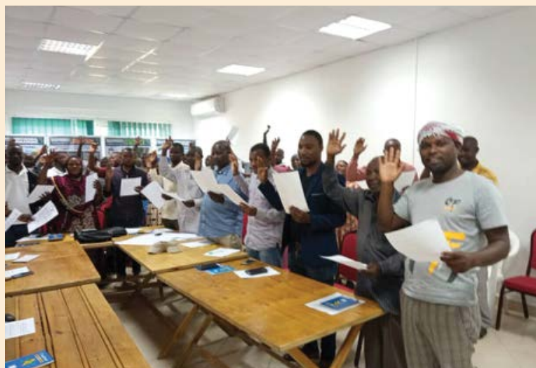
Wajumbe wa Bodi za Vyama vya Ushirika Ushirika vya Wakulima wa Miwa kutoka Kagera, Mtibwa, Kilosa, Kilombero na Mbigiri (Magore) wakiapa kiapo cha Uadilifu kabla ya kuanza majukumu yao ya kazi katika Vyama vyao vya Ushirika

kutoka COASCO Tanga kwa lengo la kuongeza wigo wa ufanisi katika utendaji. Wajumbe katika mafunzo hayo walipata Elimu ya Ushirika kwenye maeneo mbalimbali kama vile Dhana ya Ushirika, Utawala Bora na Maadili, Utatuzi wa Migogoro, Masuala ya Kodi, Uandaaji na Udhhibiti wa bajeti, Masuala ya Rushwa kwenye Vyama vya Ushirika, huduma kwa wanachama, uandaaji wa makisio, ukomo wa madeni, kupanga mpango mkakati, ununuzi na Itifaki.