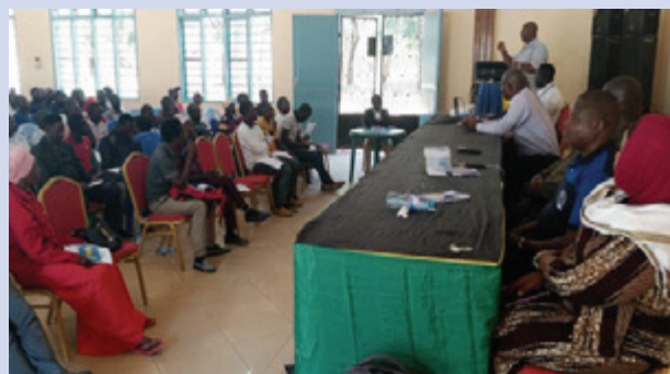
Wajumbe wa Bodi za Vyama vya Ushirika Mkoani Tabora (Urambo) wakiwa katika mafunzo

Wajumbe wa Bodi za Vyama vya Ushirika Mkoani Tabora wameanza kupatiwa Mafunzo ya Usimamizi wa Vyama hivyo. Mafunzo yalianza kutolewa Wilayani Urambo kuanzia tarehe 09 hadi 10/05/2022; na Mafunzo yaliendelea kutolewa Wilayani Kaliua kuanzia tarehe 11 hadi 12/05/2022, Sikonge kuanzia tarehe 13 hadi 14/02022, Uyui 16 hadi 17/05/2022 na mwisho Tabora Manispaa kuanzia tarehe 18 hadi 19/05/2022.