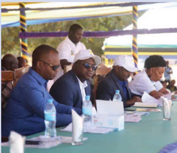
Naibu Waziri wa Kilimo, Mhe. Anthony Mavunde, (wa tatu kulia) akifuatilia ufunguzi wa Maadhimisho ya Siku ya Ushirika Duniani (SUD - 2022), mjini Tabora.

Naibu Waziri ametoa wito huo wakati akifungua Maadhimisho ya Siku ya Ushirika Duniani (SUD) yaliyoanza tarehe 28 Juni, 2022 Mjini Tabora ambapo Wanaushirika nchini kote walikutana kwa lengo la kutathmini mafanikio na changamoto zinazojitokeza katika Sekta ya Ushirika nchini.