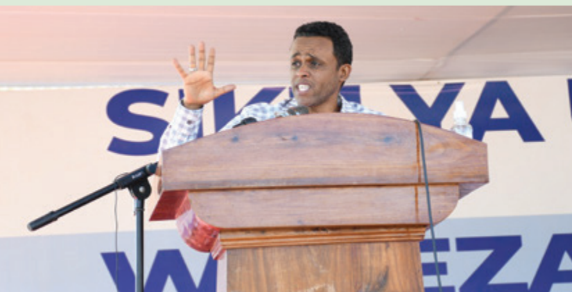
Waziri wa Kilimo, Mhe. Hussein Bashe akizungumza na Wanaushirika katika Maadhimisho ya SUD - 2022

“Lazima tuanze Safari ya Kuongeza thamani ya mazao yetu, tuchague Viongozi ambao ni Wanaushirika wenzetu na wenye uchungu na Mali za Ushirika,” ameeleza Mhe. Bashe.