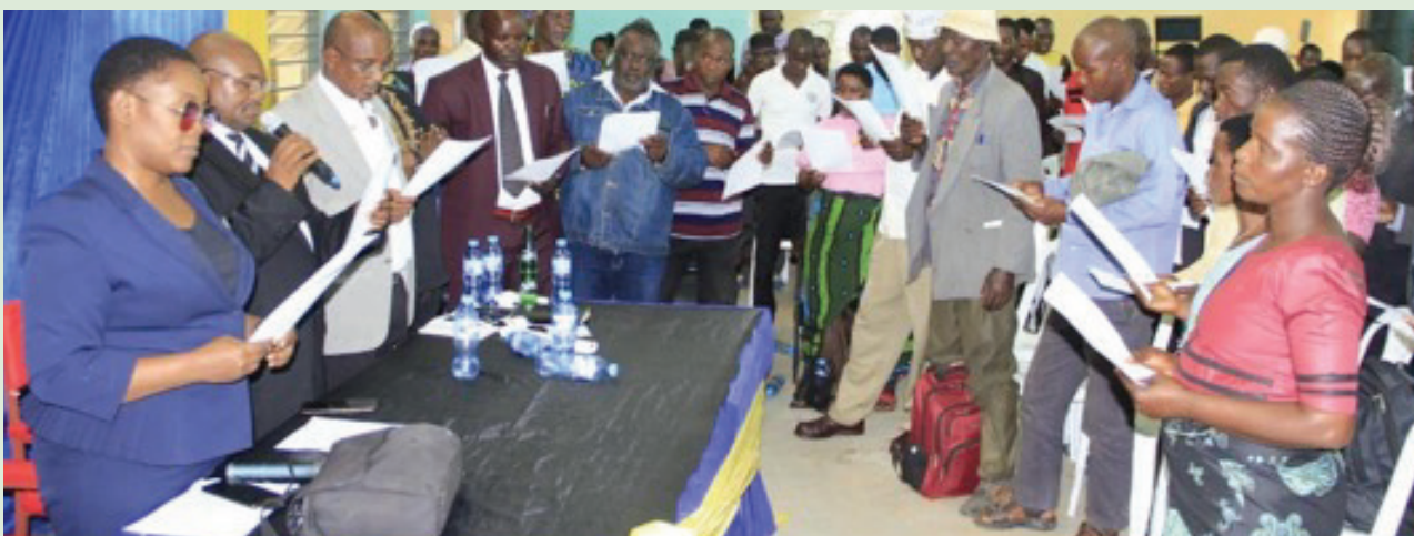
Viongozi wa Vyama vya Ushirika Mkoani Shinyanga wakila kiapo cha kutekeleza majukumu yao kwa mujibu wa sheria

Mkoa wa Shinyanga una jumla ya vyama vya Ushirika vya Msingi 457 vyenye jumla ya wanaushirika 46,395. Pia kuna vyama vya Upili vitatu vinavyojumuisha Union mbili za SHIRECU LTD na KACU LTD. Pia, Mkoa una jumla ya SACCOS 7 ambazo zimepata leseni kati ya SACCOS 20 zilizopo katika Mkoa mzima.