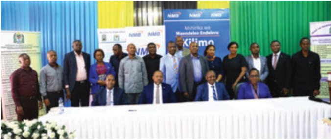
Picha ya pamoja mara baada ya kutia saini Randama ya Makubaliano kati ya TCDC na NMB