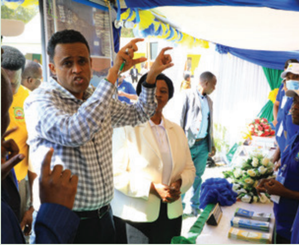
Waziri wa Kilimo, Mhe. Hussein Bashe akitembelea mabanda ya Wanaushirika katika Maadhimisho ya SUD - 2022