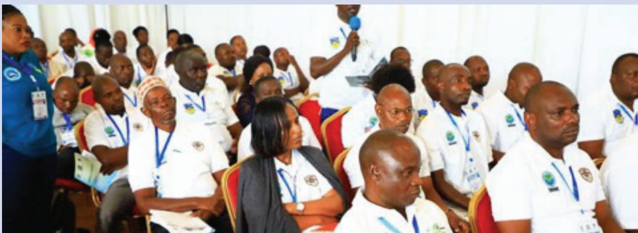
Wanaushirika wakiwa katika Kongamano la Pili la Taftiti za Ushirika

Amesema, hali hiyo imefanya taftiti hizo kubaki kwenyemakaratasikutokananalughainayotumika katika kuziandaa na kutokusambazwa kwa walengwa. "Kutokana na hali hiyo ikaonekana umuhimu wa kuandaa kongamano la kwanza la taftiti za Ushirika na hatimaye kuazimia kuwa na kongamano kila mwaka ili tuweze kupata fursa ya kujadiliana matokeo ya taftiti na namna ya kutatua changamoto zilizopo katika Sekta ya Ushirika." amesema Dkt. Zakayo.