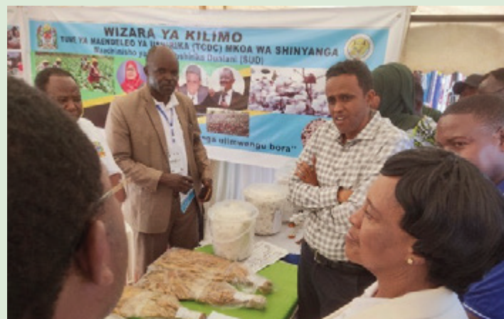
Waziri wa Kilimo, Mhe. Hussein Bashe akitembelea mabanda ya Wanaushirika katika Maadhimisho ya SUD - 2022

“Kama Mimi ni mkulima nipewe haki ya kuchaguliwa, kuchagua Viongozi ninaowataka